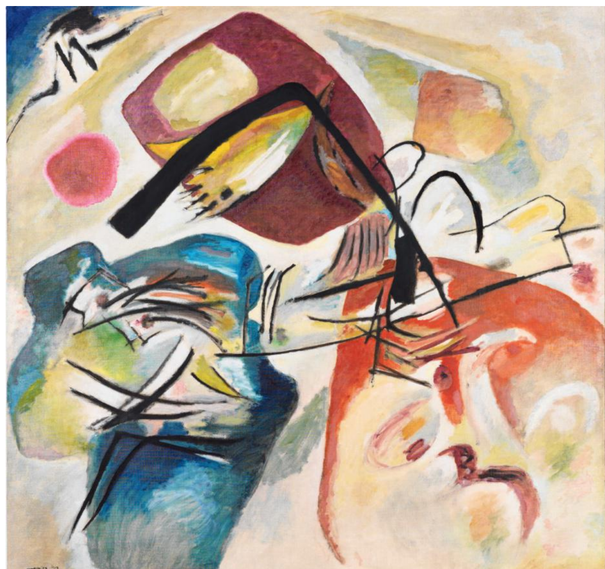
Wassily Kandinsky: Mit dem schwarzen Bogen (1912)