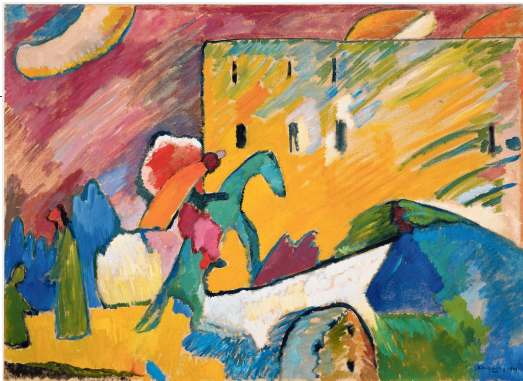
Wassily Kandinsky: Improvisation 3 (1909) COLLECTIE CENTRE POMPIDOU